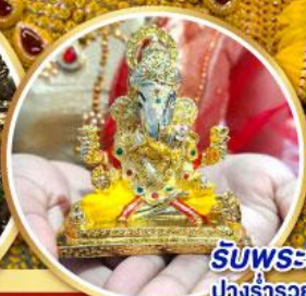
รับพระพิฆเนศ ปางรำรอย ท่านละ 1 องค์