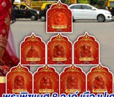
พระพิฆเนศ 8 องค์ เมืองปูณ