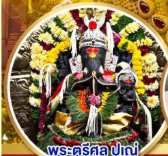
พระศรีศูล ปูณ (Trishul Pune)