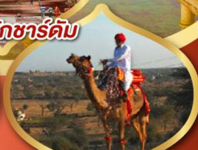
ฟรี ขี่อูฐ เมืองมันทอวา ราคาเริ่มต้น