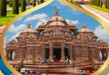
วิหารอักซาร์ดีม