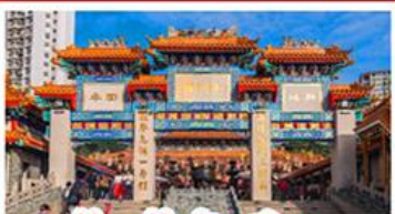
วัดเข่งต้าเซียน