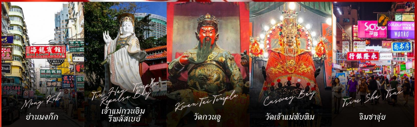
Mong Kok ย่านมงก๊ก

รายการทัวร์ข้างต้นอาจมีการปรับเปลี่ยนเพื่อความเหมาะสม