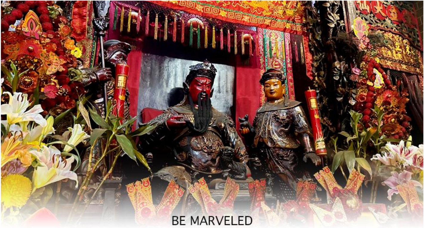
BE MARVELED วัดกวนอู

คงไม่ให้เพลิงพลาแกศัตรู ทำให้มีมิตรที่ซื่อสัตย์ และคุ้มครองบริวารให้ก้าวหน้าและอยู่เย็นเป็นสุข ซึ่งผู้ประกอบอาชีพ ตำรวจ ทหาร และ นักการเมือง จึงมักจะนิยมบูชาเทพเจ้ากวนอู เป็นพิเศษ