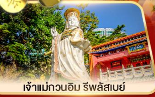
เจ้าแม่กวนอิม ริฟลีสเบย์