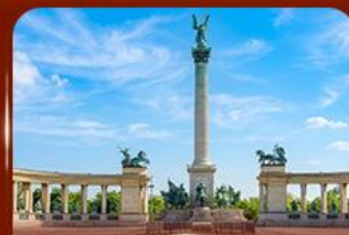
จัตุรัสวีรบุรุษ บูดาเปสต์