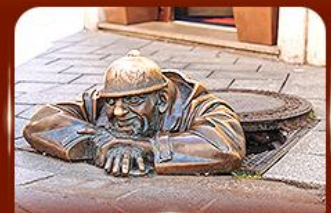
แลนด์มาร์คคัง รูปปั้นคูมิล ปรากสโลวา