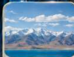
ทะเลสาบชิงไห่ (ไม่รวมรถกอล์ฟ)