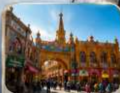
เมืองเก่าคาซการ์ (พิธีเปิดเมือง)