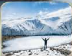
ธารน้ำแข็งมูซตาغاتา (รวมรถกอล์ฟ)