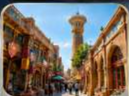
ตลาดอับบาซาร์

** เกี่ยวครบทุกวัน...ไม่ลงร้านช้อปปิ้ง **