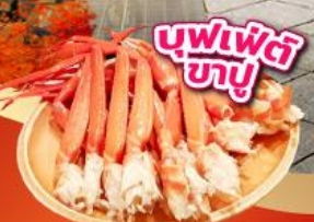
บุฟเฟ่ต์ ซาซู

เช็किनจุดถ่ายรูป ศาลเจ้าฟูจิซัง ฮ่องกงเซ็นทรัล