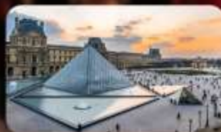
เข้าชมพิพิธภัณฑ์ลูฟวร์