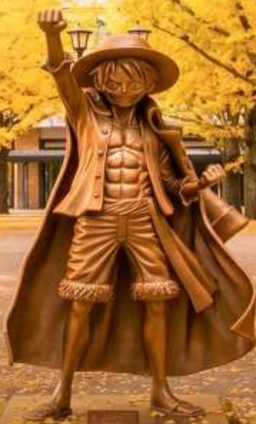
STONE BRIDGE MONKEY-D-LUFFY

สัมผัสใบไม้เปลี่ยนสีแห่งคิวชูตอนเหนือ ที่สุดแห่งฤดูกาล