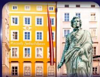
บ้านเกิดโมสาร์ท ซาลซ์บูร์ก