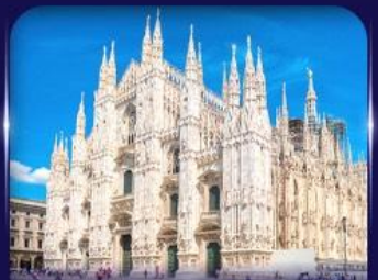
เซนต์มาร์กาเรต มิลาโน