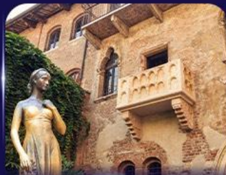
เขื่อนบ้านจูลีเยต เวโรนา