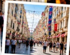
ISTIKLAL STREET (Grand Avenue of Pera) ถนนสายช้อปปิ้ง ยืน 88 ตรกม.ในทีเดียว