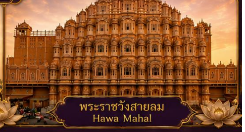
พระราชวังสายลม Hawa Mahal