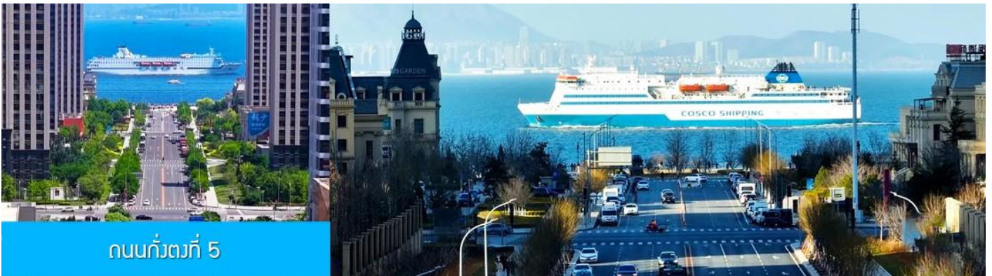
ถนนกังตงที่ 5

หลังอาหารนำท่านเที่ยวชม ถนนกังตงที่ 5 港东五街 จุดเช็คอินใหม่ที่ได้รับความนิยมอย่างสูงจากนักท่องเที่ยวและชาวเมืองต้าเหลียน จุดนี้เป็นช่วงที่ถนนสายกังตงที่ห้า มุ่งตรงสู่ทะเล(มองจากจุดชมวิวที่อยู่ด้านบน) เสมือนว่าปลายทางของถนนไปสิ้นสุดในทะเล อีกด้านจะมองเห็นท่าเรือและอาคารสถาปัตยกรรมตะวันตกเป็นกรอบของมุมมองที่งดงาม เมื่อมีเรือแล่นมาผ่านทะเลตรงบริเวณนี้ จะเป็นภาพที่สวยงามและ โรแมนติค