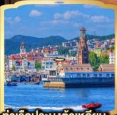
ท่าเรือประมงต้าเหลียน