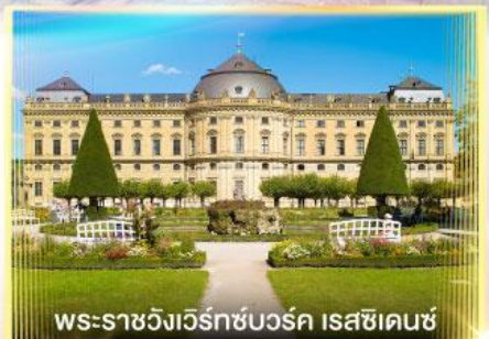
พระราชวังแวร์ซายส์ ไรชชิ่งเฮาส์