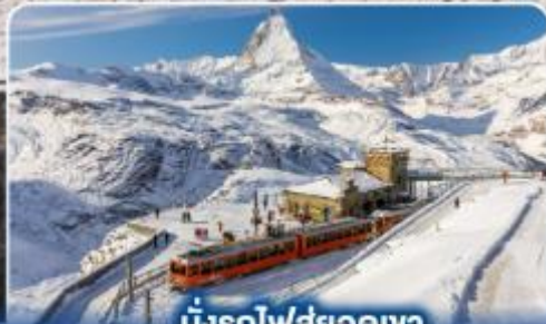
นั่งรถไฟสู่ยอดเขา กรอนเนอร์เกรต