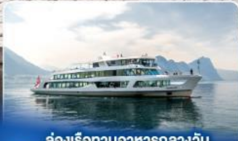
ล่องเรือทานอาหารกลางวัน ทะเลสาบลูซิิร์น