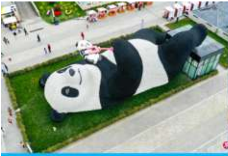
ตุ๊กตาทมิแพนดาเซลฟี