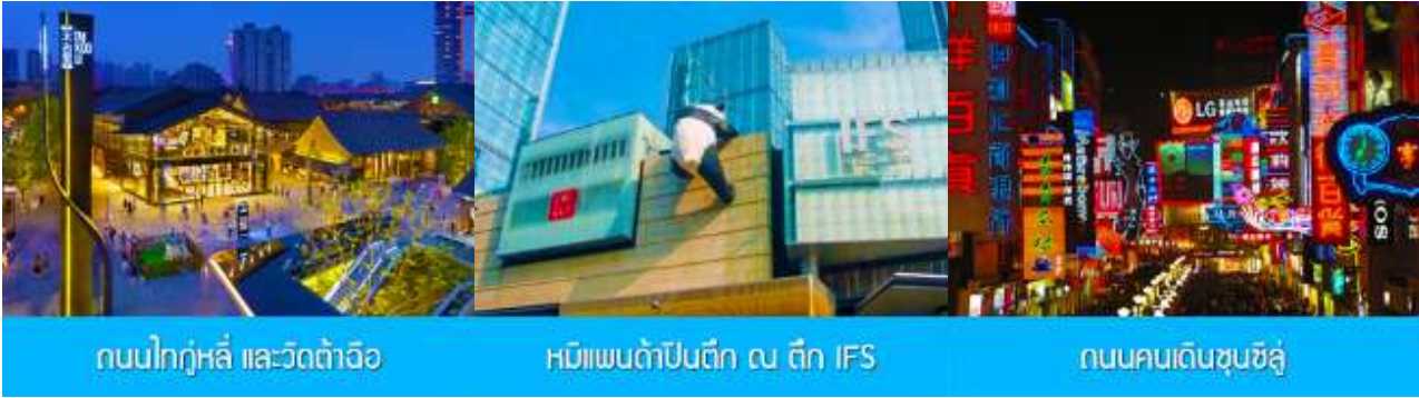
ถนนไท่กุ่หลี่ และวัดต้าอ้อ