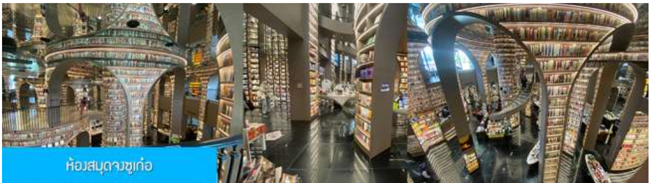
ห้องสมุดจชชุก่อ