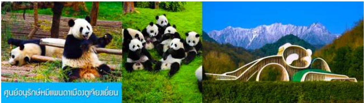
ศูนย์อนุรักษ์หมีแพนด้าเมืองตูเจียงเย็น

เช้า รับประทานอาหารเช้า ณ ห้องอาหารของโรงแรม (7) หลังอาหารท่านสามารถเลือกที่จะซื้อโปรแกรมทัวร์เสริม หรืออิสระพักผ่อนตามอัธยาศัยในโรงแรม