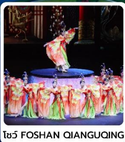
โชว์ FOSHAN QIANGQING