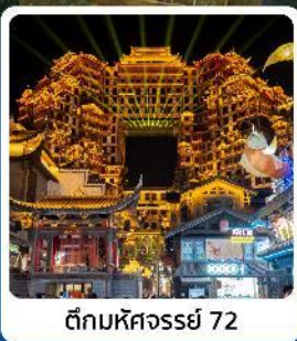
ตึกหอคจรรย 72