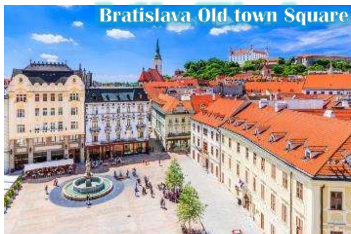
Bratislava Old town Square

บ่าย นำท่านเดินทางสู่กรุงบราติสลาวา, ประเทศสโลวัก นำท่านเข้าชมเมืองเก่าบราติสลาวา สัมผัสบรรยากาศเมืองเก่า และถ่ายภาพกับโรงละครโอเปร่า สัญลักษณ์แห่งความหรรษาของประเทศ และเก็บภาพรูปปั้นที่ซ่อนอยู่ในตัวเมือง ไม่ว่าจะเป็นรูปปั้นโปเลียนหน้าสถานทูตฝรั่งเศส หรือรูปปั้นปาปาริซซ์รวมถึง ไฮไลต์ของเมืองคือรูปปั้นของคนที่ตกท่อคูมิล” (Man at Work) ที่โด่งดัง ณ แห่งนี้เคยถูกรถชนมาแล้วถึง 2 ครั้ง ในปัจจุบันจึงมีป้าย เขียนว่า “Man at Work” ปักอยู่บริเวณดังกล่าว เป็นสัญลักษณ์ช่วงที่เป็นคอมมิวนิสต์ และตำนานยังคงเล่าต่อไปว่าอาจจะเป็นคุณลุงที่เหน็ดเหนื่อยกับการทำงานอยากจะพักผ่อนบ้างตามประสานักงานหนัก จากนั้นนำท่านชม “ประตูไมเคิล” ซึ่งซุ้มประตูไมเคิลก่อสร้างสไตล์โกธิคสูง 51 เมตร มีอยู่ทั้งหมด 4 แห่ง ปัจจุบันเป็น ประตูเพียงแห่งเดียวที่ยังเหลืออยู่ ประตูไมเคิลมียอดโดมทรงหัวหอมตามศิลปะบารอก 3 ชั้น ลดหลั่นกัน ประตูแห่งนี้ตั้งอย่างศูนย์กลางเมืองเก่า สองฝั่งถนนมีอาคารเก่าแก่หลาก สี สัน สไตล์อาร์ตนูโวตั้งเรียงรายอยู่ทำให้บรรยากาศคึกคัก