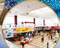
ตลาดกึ่งเปีย