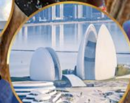
โรงแรมหรูไฮมุก