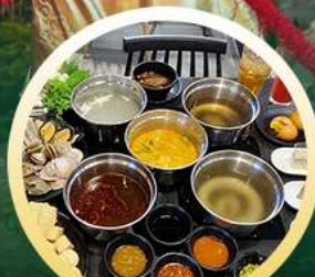
ซาบูฮ่องกง

02-04 มิ.ย. 18-20 มิ.ย. 07-09 มิ.ย. 20-22 มิ.ย. 13-15 มิ.ย. 25-27 มิ.ย. 14-16 มิ.ย. 28-30 มิ.ย.