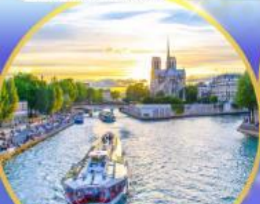
ล่องเรือแม่น้ำเซน