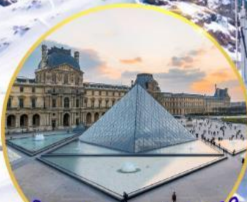
ถ่ายรูปหอไอเฟลที่ลูฟร์ GO3CDG-EK056