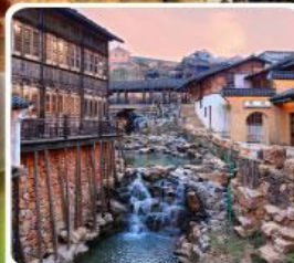
เมืองโบราณเหยาหู