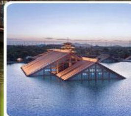
พิพิธภัณฑ์ไดน้ำ กวางฟู่หลิน