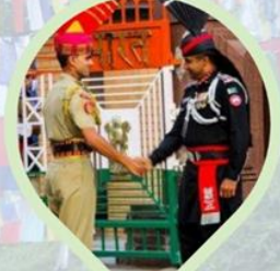
พิธีลดธงพระมหากษัตริย์ อินเดีย-ปากีสถาน ชายแดนวากา (Wagah border)