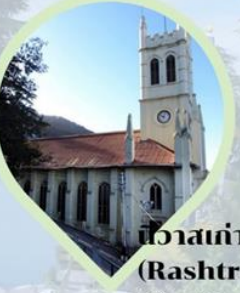
พิพิธภัณฑสถานแห่งชาติ (Rashtrapati Niwas) เมืองชิมลา