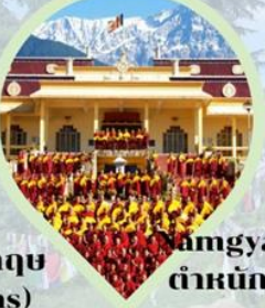
Amgyal Monastery ตำหนักองค์ดาไลลามะ ดาร์มซาล่า