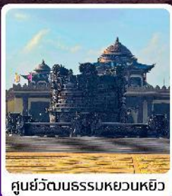
ศูนย์วัฒนธรรมหยวนเหยิว