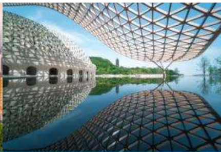
อุทยานก่อกมกั๊วหนิวโล้วซาน