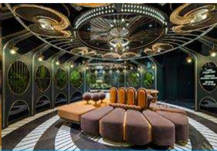
ห้องน้ำไอเทค