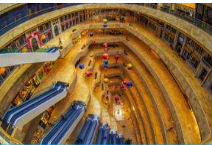
จัตุรัสเต๋อจี

พักที่ โรงแรม Holiday Inn Express Dongshan Hotel 4* หรือเทียบเท่าในนครหนานจิง