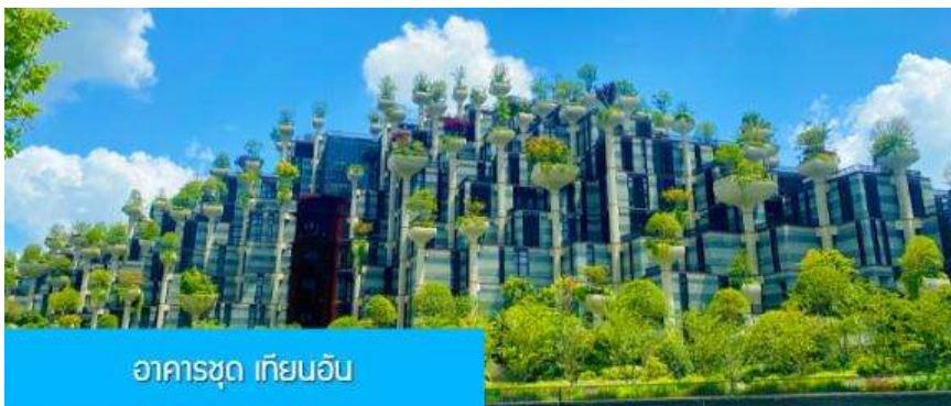
อาคารชุด เทียนอัน

เที่ยง รับประทานอาหารกลางวัน ณ ภัตตาคาร (6)