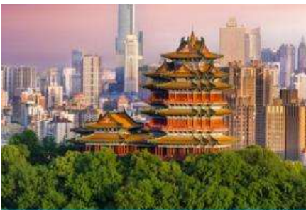
นครนานกิง