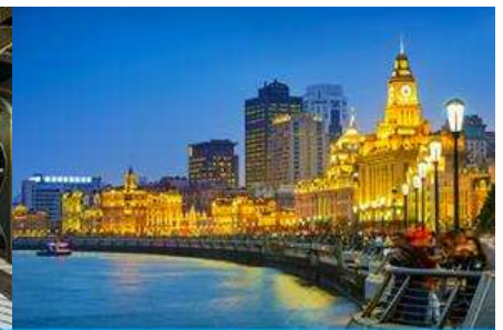
หาดไว่กาน