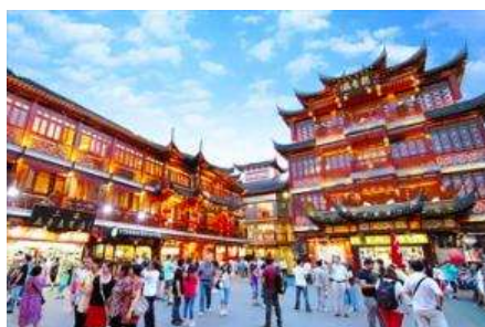
ตลาดร้อยปีฉงหวงเบี่ยน

พักที่ โรงแรม Holiday Inn Express Hotel 4* หรือเทียบเท่าในนครเซี่ยงไฮ้