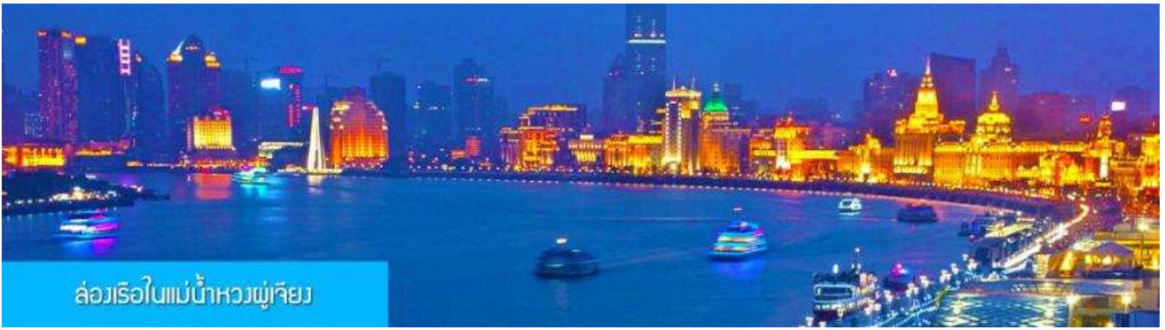
ล่องเรือในแม่น้ำหวงผู่เจียง