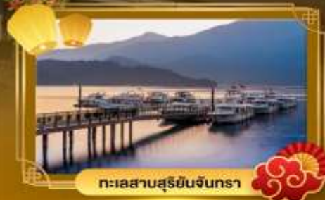
ทะเลสาบสุริยอินจันตรา