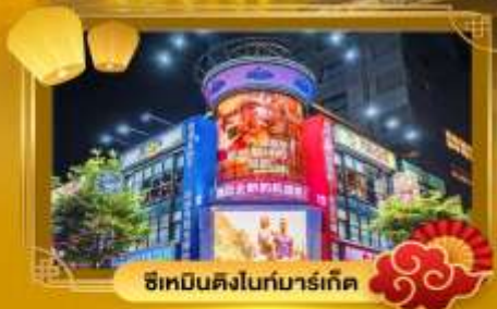
ช้อปปิ้งดิงโถกมาร์เก็ต