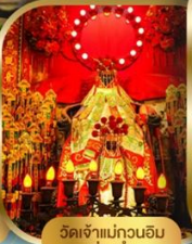
วัดเจ้าแม่กวนอิม ฮ่องซา