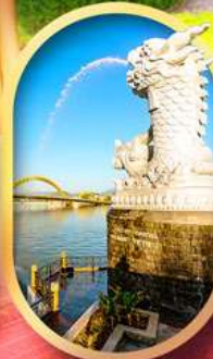
คาร์พดราท้อน