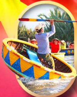
ล่องเรือกระดังง์