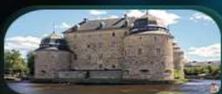
ปราสาทโอเรโบ