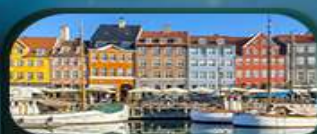
ย่านนูซาวน์