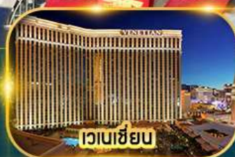
เวเนเซียน