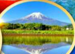
ทะเลสาบคาวากูจิโกะ