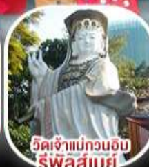
วัดเจ้าแม่กวนอิม รีพัลส์เบย์