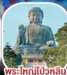
พระใหญ่ไผ่หวิน