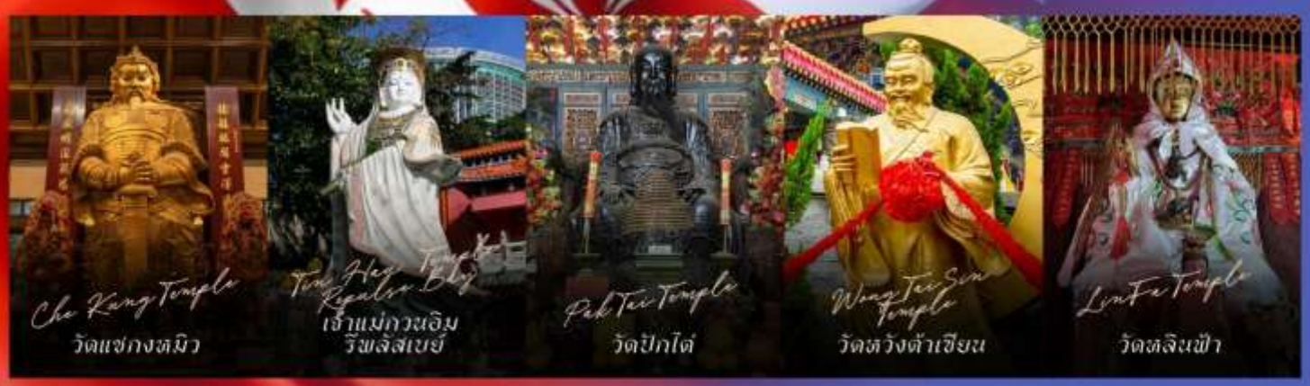
Che Kung Temple วัดเซกทมิว

รายการทัวร์ข้างต้นอาจมีการปรับเปลี่ยนเพื่อความเหมาะสม