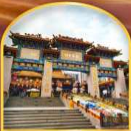
วัดหวังต้าเซียน ขอพรด้านสุขภาพ