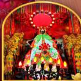
เจ้าแม่กวนอิมย่งฮ่า ที่มีอายุกว่า 600 ปี

สนุกสนานไปกับสวนสนุกดิสนีย์แลนด์แบบเต็มวัน