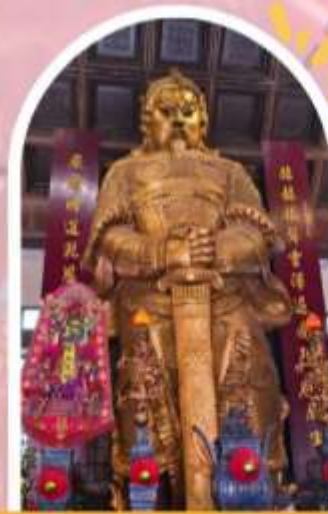
วัดแซกกง ขอพรโชคลาก การเงิน และธุรกิจ