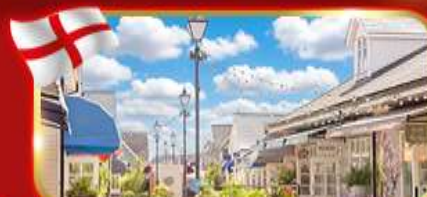
ช้อปปิ้งอาร์กเิลัน Bicester village