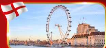
ชมวิวชิงช้าที่สูงที่สุดในยุโรป ลอนดอนอาย