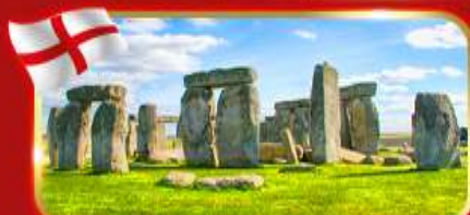
สโตนเฮนจ์ สิ่งมหัศจรรย์ของโลก