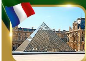
พีระมิดที่ลูฟวร์ ปารีส