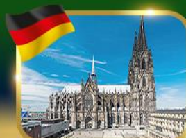
มหาวิหารแห่งเมืองโคโลญ