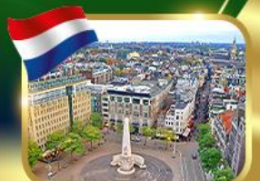
จัตุรัสดันสแควร์ อัมสเตอร์ดัม