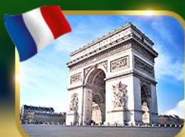
ประตูชัยฝรั่งเศส ปารีส