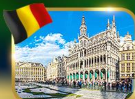
จัตุรัสกรองด์ ปลาซ บริซเซลส์