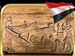
สุสานใต้ดินอเล็กซานเดรีย

เข้าชมพิพิธภัณฑ์อียิปต์แห่งใหม่ (GRAND EGYPTIAN MUSEUM)