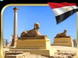
เสาสีมันปอมเปย์