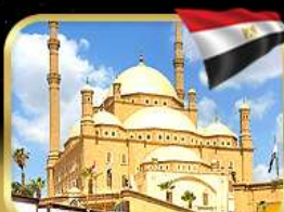
มัสยิดโมฮัมหมัดอาลี