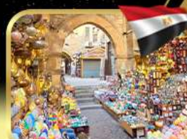
ตลาดชานอลคาลิ