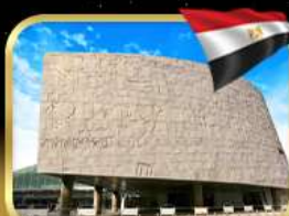
ห้องสมุดอเล็กซานเดรีย