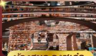
ห้องสมุด จงซูเก๋อ