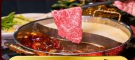
ชาบูหม่าล่าไม้อัน