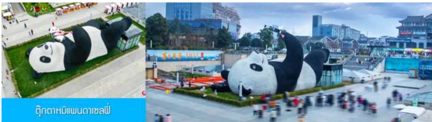
ตุ๊กตาหมีแพนดาเซลฟี

นำท่านชม ตุ๊กตาหมีแพนดาเซลฟี 自拍大熊猫 เป็นตุ๊กตาแพนด้าขนาดยักษ์ น้ำหนัก 130 ตันในท่านอนหงายขาไขว่ห้างท่าทำเซลฟีอยู่กลางแจ้ง ที่ได้กลายเป็นแลนด์มาร์คของเมืองและเอกลักษณ์ที่ผู้มาเยือนเมืองนี้ต้องแวะมาเช็คอิน ถ่ายรูป.....จากนั้นนำท่านเดินทางสู่เมืองเฉิงตู (ระยะทาง 68 กม. ใช้เวลาเดินทางราว 1 ชั่วโมง)