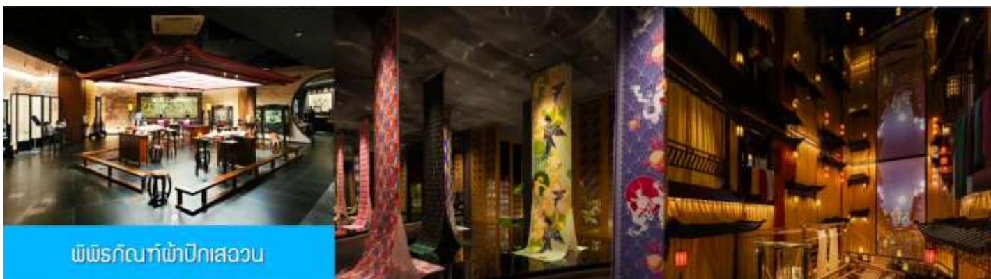
พิพิธภัณฑ์ผ้าปักเสฉวน