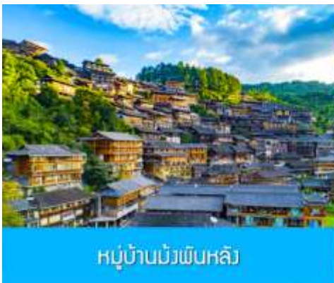
หมู่บ้านม้งพันหลัง