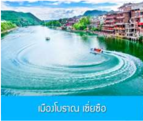
เมืองโบราณ เซี่ยซื่อ