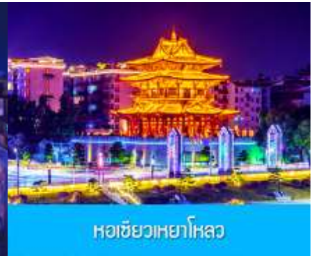
หอชิวเหยาโหลว

จากนั้นให้ท่านอิสระเดินเล่น ซ้อปั้ง ย่าน ดงซีเจียง 东西巷 ที่เป็นแหล่งช้อปปิ้งแห่งใหม่ของเมืองกุ้ยหลิน ในย่านนี้นอกจากท่านจะสามารถเดินชม หรือเลือกซื้อสินค้าแล้ว ที่นี่ยังเป็นแหล่งรวมของร้านอาหาร In trend