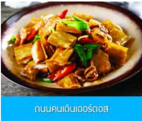
ถนนคนเดินเออร์คอส

จากนั้นนำท่านเที่ยวชม อุทยานคังปาสิอ 康巴什景区 เป็นเขตเมืองใหม่ที่ถูกเนรมิตรขึ้นและได้รับการขึ้นทะเบียนเป็นอุทยานท่องเที่ยวระดับ 4A และเป็นศูนย์กลางความเจริญของเมืองเออร์คอส ประกอบด้วยจัตุรัส ซิมปาร์ค พิพิธภัณฑ์ แกรนด์เธียร์เตอร์ ศูนย์วัฒนธรรม และสนามแข่งรถนานาชาติ นำท่านนั่งรถผ่านชมจัตุรัสรัฐบาล ทะเลสาบอุหลันมู่ สวนศิลปะงานปาติมากรรมเอเชีย ฯลฯ