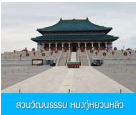
สวนวัฒนธรรมหมงกู่หยวนหลิว

พักที่ ORDOS BOYU AIRUI HOTEL โรงแรมระดับ 4 ดาวท้องถิ่น หรือเทียบเท่าในเมืองเออร์ดอส