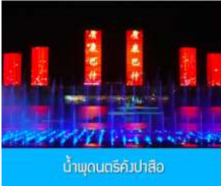
น้ำพุดนตรีคังปาสื่อ

จากนั้นนำท่านเดินทางกลับสู่ เมืองเออร์ดอส 鄂尔多斯 (ระยะทาง 180 กิโลเมตรใช้เวลาประมาณ 3 ชั่วโมง ) รับประทานอาหารค่ำ ณ ภัตตาคาร (9)