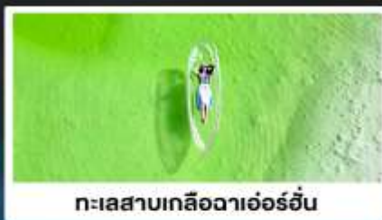
ทะเลสาบเกลือดาเอ๋อร์อัน