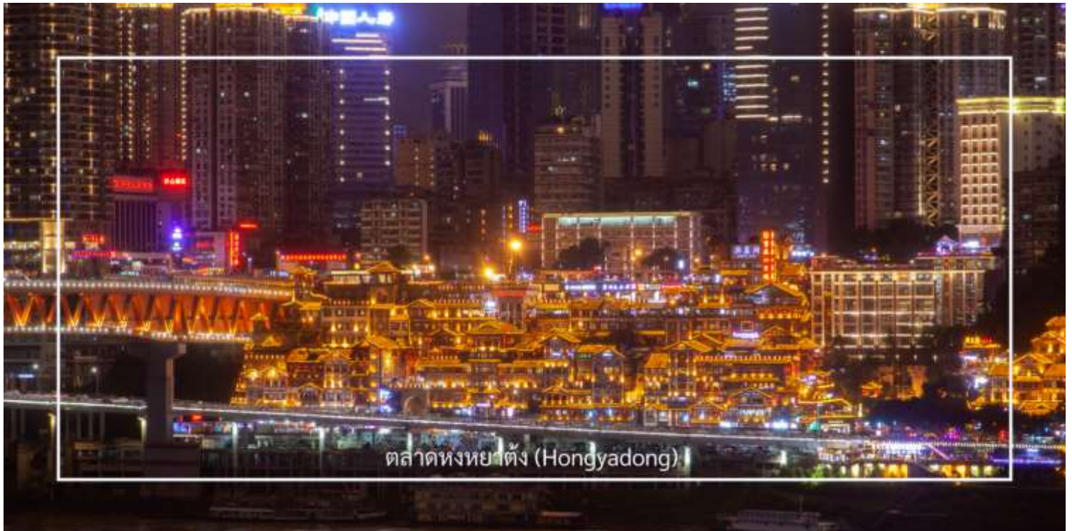
ตลาดหงหยาดัง (Hongyadong)

จากนั้นเดินทางไปยัง ตลาดหงหยาดัง (Hongyadong) หรือที่เรียกว่า "Hongya Cave" เป็นสถานที่ท่องเที่ยวที่มีชื่อเสียงในเมืองฉงชิ่ง โดยตั้งอยู่ริมแม่น้ำแยงซี มีบรรยากาศที่เต็มไปด้วยวัฒนธรรมและประวัติศาสตร์ ตลาดหงหยาดังเป็นพื้นที่ที่มีอาคารแบบดั้งเดิมที่สร้างขึ้นในสไตล์สถาปัตยกรรมแบบชิโน-ทิเบต โดยมีร้านค้า ร้านอาหาร และบาร์จำนวนมาก ที่นี่ท่านสามารถลิ้มลองอาหารรสเด็ดและชมพื้นเมืองอื่นๆที่ขึ้นชื่อ ตลาดหงหยาดังยังมีวิวทิวทัศน์ที่สวยงามสามารถเดินเล่นตามทางเดินที่มีการจัดแสดงงานศิลปะและสินค้าท้องถิ่น