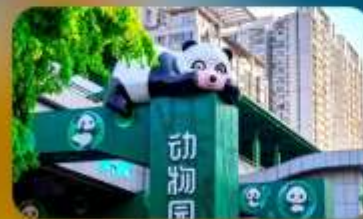
สถานีหมี่แพนด้า