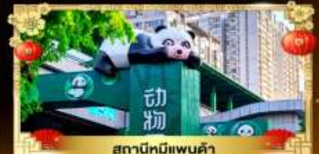
สถานีหมีแพนด้า