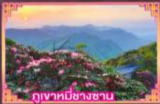
ภูเขาที่มีชาวชน