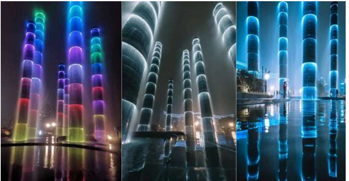
นำท่านชม ไฟน้ำพุไม้ไฟติ๊กSKP แสงสียามค่ำคืนที่ ลานห้างสรรพสินค้า SKP แลนด์มาร์คแห่งใหม่