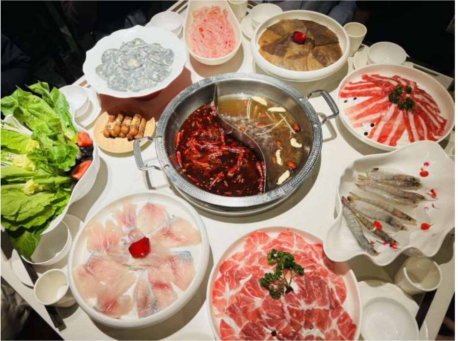
คำ รับประทานอาหารคำ ณ ภัตตาคาร (เมื่อที่ 9) *เมนูพิเศษ สุกีหมาล่าเสฉวน