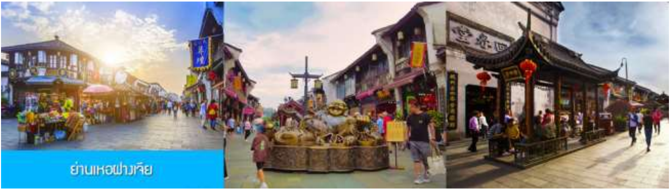
ย่านหอฝางเจีย