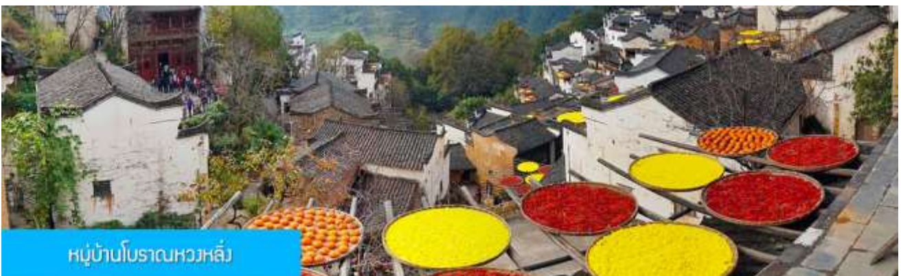
หมู่บ้านโบราณหวงหลิ่ง