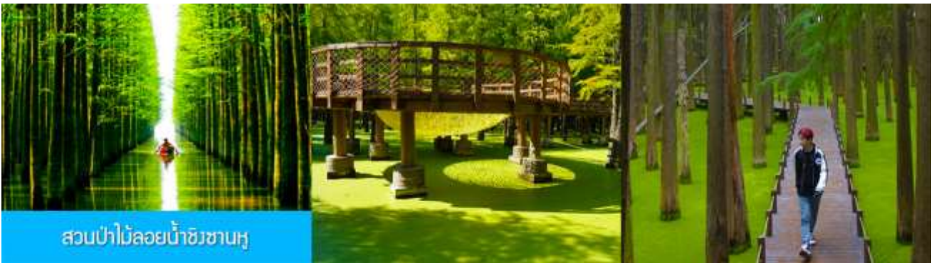
สวนป่าไผ่ลอยน้ำชิงซานหู

พักที่ PAIJING HOLIDAY HOTEL โรงแรมระดับ 4 ดาวท้องถิ่น หรือเทียบเท่า เมืองหวงซาน