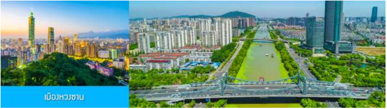
เมืองหวงซาน